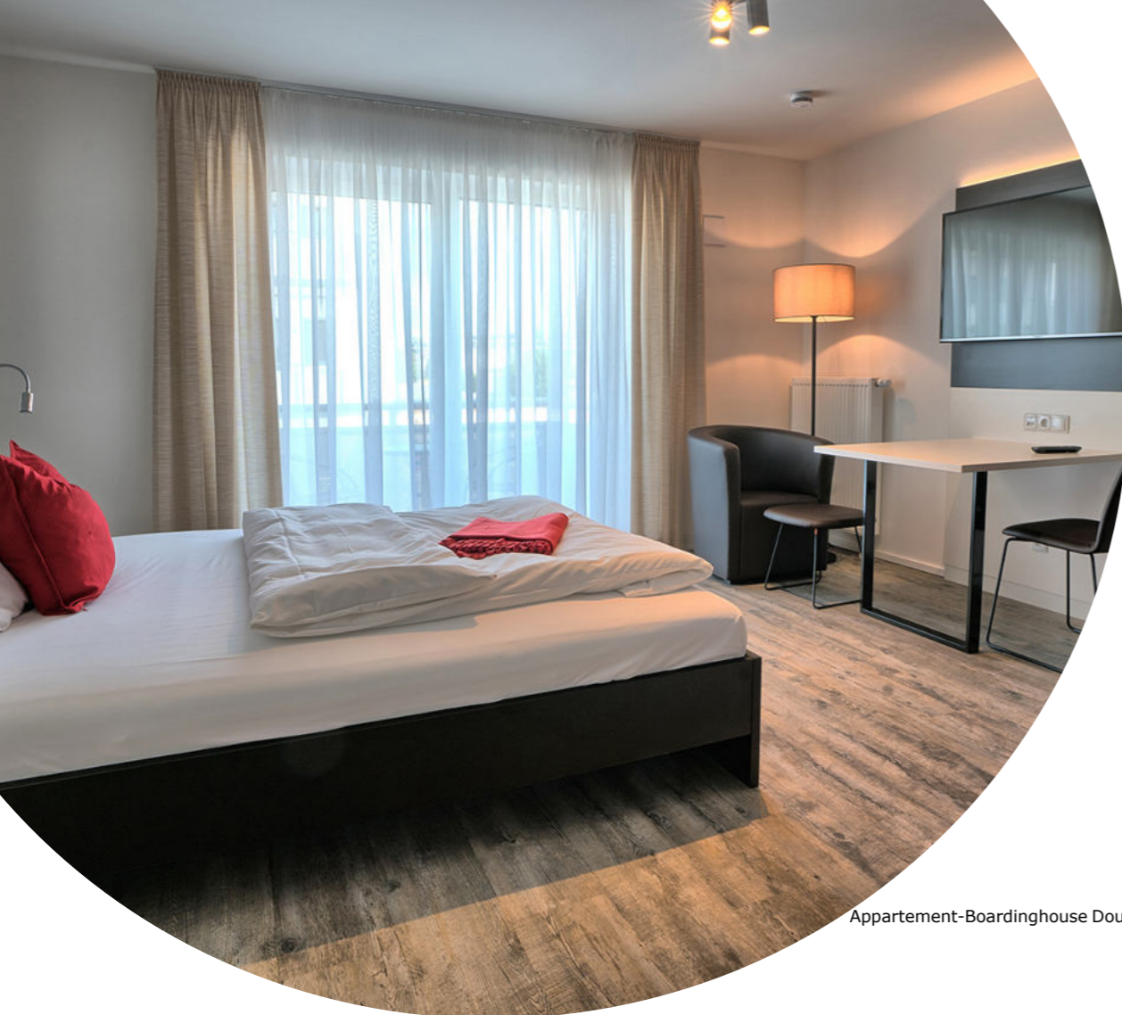
Appartement-Boardinghouse Double Studio