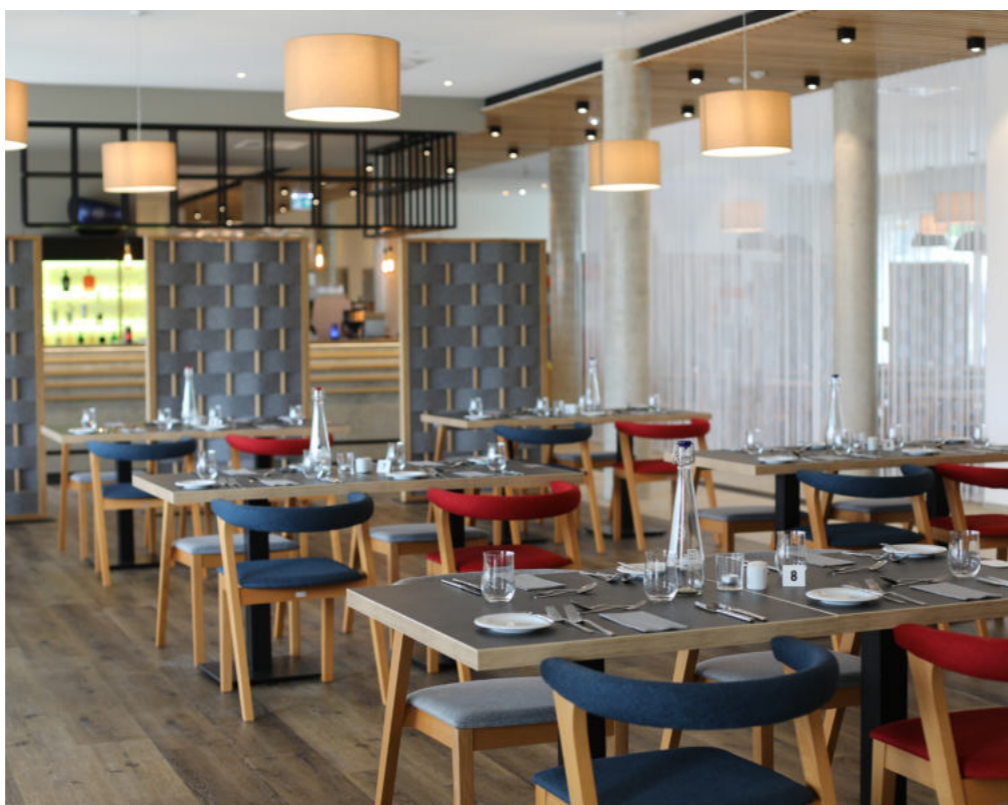
# 38 Hotel-Kompetenz-Zentrum

Bis zur Eröffnung im Juli 2021 hat eine drei Jahre andauernde Planungs- und Bauphase ihr sehenswertes Ende gefunden. Das Hotel an sich ist einzigartig in der Region und bietet neben 84 komplett barrierefrei konzipierten Hotelzimmern als Inklusionsbetrieb auch rund 30 Arbeitsplätze für Menschen mit und ohne Behinderung. „Wir wollten mit INCLUDIÖ einen echten Ort der Begegnung schaffen, in dem Menschen mit unterschiedlichen Behinderungen als Urlaubs- oder Businessgäste problemlos übernachten können. Gleichzeitig wollten wir aber auch gemeinsame Arbeitsplätze für Menschen mit und ohne Behinderung, ganz im Sinne der Inklusion, entstehen lassen. Das, so bin ich überzeugt, ist uns mit INCLUDIÖ gut gelungen“, erläutert Martin Steinkirchner.