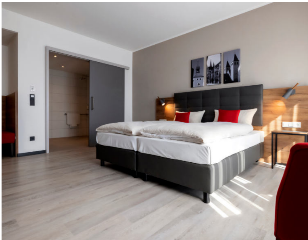
INCLUDIÖ Regensburgs erstes Inklusionshotel

Mehrere Besuche im Hotelkompetenzzentrum wurden sowohl in der Planungsphase als auch bei der Beschaffung der FF & E und auch der OS & E genutzt um sich einen guten Angebotsüberblick zu verschaffen. Zum Einsatz im Hotel kommen nun zum Beispiel Produkte von Assa Abloy, Brita, FBF bed&more, HEWI oder auch niewiederbohren und WMF Tischkultur.